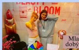
Mladé inovátorky dobývajú Bratislavu

Hlavné mesto nás privítalo dažďom a silnými vetrami. Už samotná cesta nám nehrala veľmi do kariet. Po príchode sme si náš stánok museli urýchlene nachystať, kvôli nadmernému meškaniu snáď každého vlaku na Slovensku toho dňa.