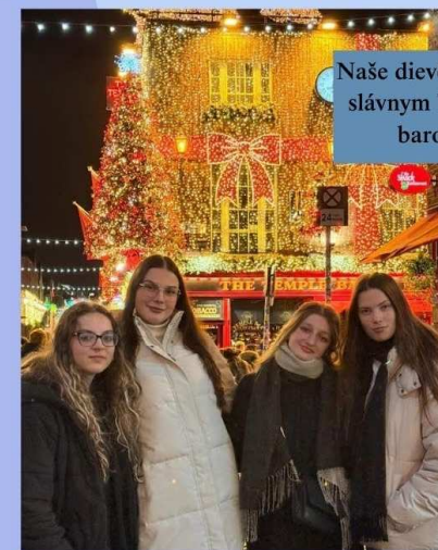
Naše dievčatá pod slávnym Temple barom

Menšie nevýhody sú také, že vám začne byť smutno za rodinou, priateľmi a dennou rutínou. Tie dva týždne však nie sú až tak veľa a keď sa vrátite domov, zistíte, že vám to tam vlastne chýba a budete smutní, že to netrvalo dlhšie.