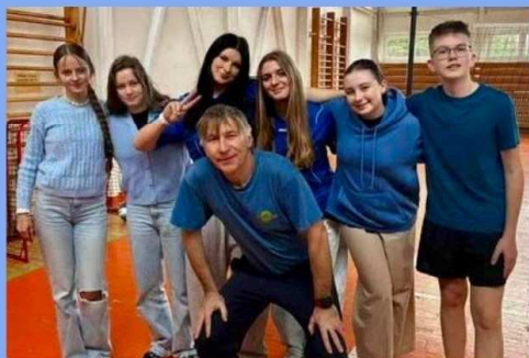
Modrá farba ako posolstvo, že každé si zaslúži byť videné, vypočuté a chránené