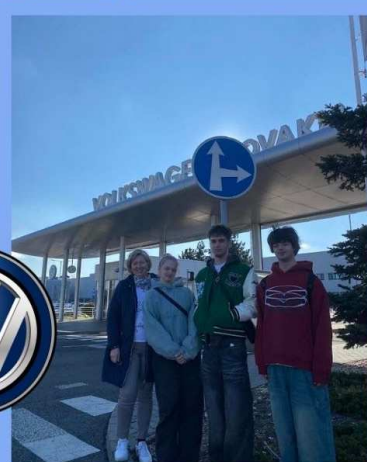
Oceľ, pohyb a chvíľa, ktorá nás naučila viac než učebnic