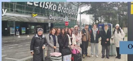
Odlet do Dublinu

Prvý deň sme odštartovali druhou, menšou výzvou – pochopiť miestnu MHD. Ono sa to síce zdá jednoduché, ale keď prídete z malého mesta na severe Slovenska do miliónovej metropoly, pri lúštení cestovného poriadku sa cítite ako na hodine matematiky, keď sa vás učiteľ spýta, akú hodnotu má X – skrátka neviete. Nakoniec sme však viac-menej bez meškania dorazili všetci do agentúry ADC College , ktorá nám bližšie predstavila mesto a vysvetlila, ako to tu chodí. Vedeli ste, že Dublinčania často prechádzajú na červenú, keď nejde žiadne auto? My veru nie a bol to pre nás celkom šok v porovnaní s tým, ako sa správame doma.