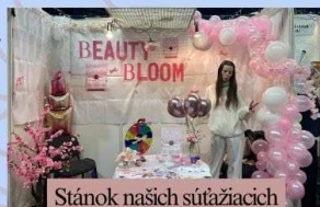
Stánok našich súťažiacich

Oba dni sme zakončili prechádzkami a skúmaním večernej Bratislavy, počas ktorého sme objavili niekoľko zaujímavých miest a užili si spoločný čas mimo školských lavíc. Výlet nám priniesol nielen nové poznatky, ale aj zážitky, na ktoré budeme ešte dlho spomínať.