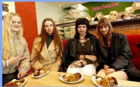
Tam, kde sa med mení na príbeh