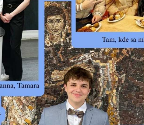
Keď úsilie dostane svoj hlas